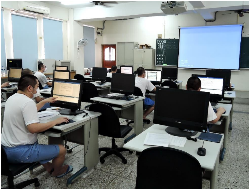
學員聚精會神解題中